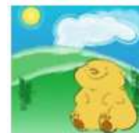
La marmotte au soleil

Si le deuxième de février Le soleil apparaît entier L'ours étonné de sa lumière Se va mettre en sa tanière Et l'homme ménager prend soin De faire resserrer son foin Car l'hiver tout ainsi que l'ours Séjourne encore quarante jours