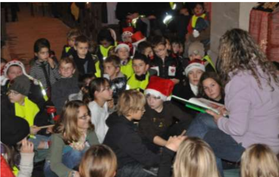
Défilé des enfants