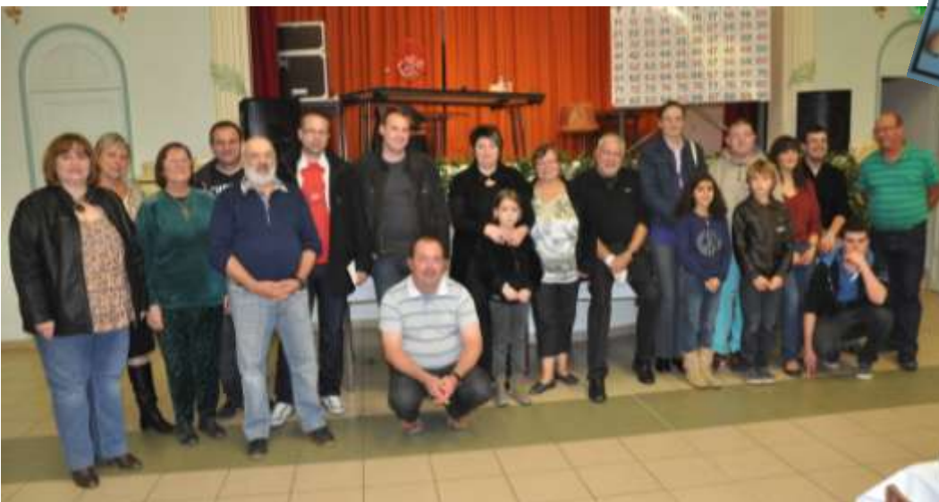
◀ Les heureux gagnants avec les membres de Mailly-animation